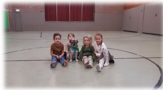
Wir nutzen die Turnhalle der Wichernschule.

Sollte es aufgrund des Förderbedarfs eines Kindes sinnvoll sein, dass dieses Kind zurückgestellt wird und ein Jahr länger in der Kita bleibt, erfolgt ein intensiverer Austausch zwischen der Schulleitung und der Kitaleitung. Dieser Austausch findet stets unter Berücksichtigung der Einverständniserklärung der Eltern statt. Wir halten es für essenziell, die Eltern in diesen Prozess einzubeziehen und sie über die Entscheidungskriterien und -möglichkeiten zu informieren. So gewährleisten wir, dass die besten Interessen des Kindes im Vordergrund stehen und individuelle Lösungen gefunden werden, die auf die jeweiligen Bedürfnisse abgestimmt sind.