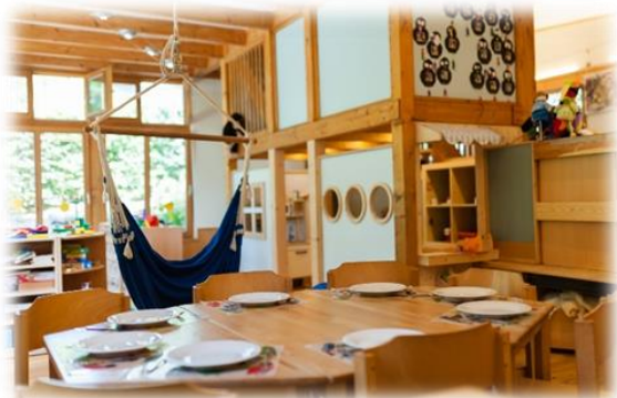
Mittagessen: Im Gruppenraum

Durch die regelmäßige Reflexion der pädagogischen Arbeit und den offenen Austausch im Team ist es möglich, die pädagogischen Ansätze flexibel anzupassen und kontinuierlich weiterzuentwickeln. Der situationsorientierte Ansatz, kombiniert mit der sensiblen Inklusionsarbeit, ermöglicht es, den unterschiedlichen Entwicklungsbedürfnissen aller Kinder gerecht zu werden – egal ob in der Großgruppe oder in kleinen Teilgruppen. Dabei steht stets das Wohl des Kindes im Mittelpunkt, und es wird darauf geachtet, dass jedes Kind die nötige Unterstützung erhält, um sich optimal zu entfalten.