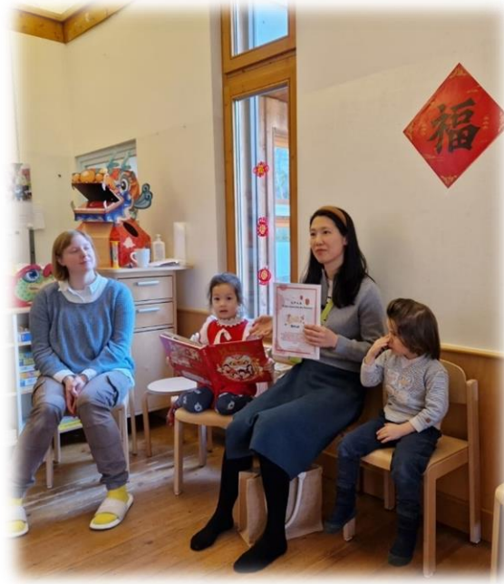
Gemeinsam mit den Eltern: Das Feiern von Festen unterschiedlicher Kulturen

Mehrsprachigkeit als Ressource: In unserem Kindergarten betrachten wir Mehrsprachigkeit als wertvolle Ressource. Kinder, die mit mehreren Sprachen aufwachsen, werden ermutigt, ihre Sprachen im Kindergartenalltag zu nutzen und zu teilen.