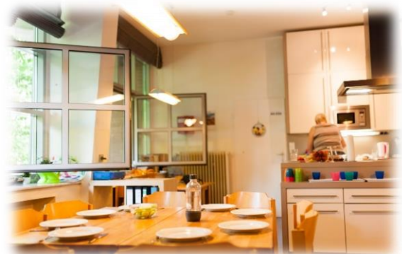
Mittagessen: In der Küche

Die personellen und räumlichen Rahmenbedingungen des Rabenhort e.V. sowie der situationsorientierte und inklusive Ansatz bieten viele Vorteile, aber auch einige Herausforderungen. Im Folgenden gehe ich auf die Vor- und Nachteile ein: