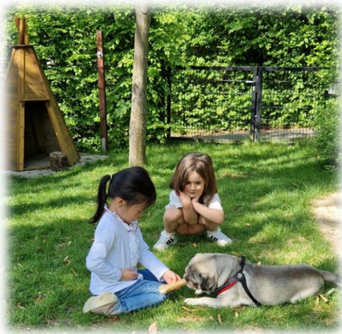
Überall mit dabei.

Für detaillierte Informationen über den Einsatz von Alfred in unserer täglichen Arbeit und die spezifischen Angebote, die wir mit ihm realisieren, verweisen wir auf unser tiergestütztes Konzept .