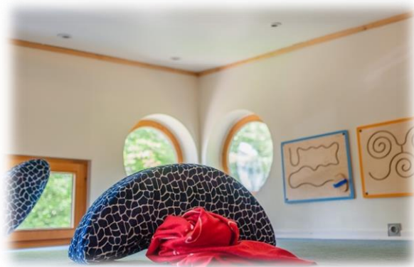
Die obere Ebene: Morgenkreis und Rollenspiel

Insgesamt bieten die räumlichen Rahmenbedingungen des Rabenhort e.V. den Kindern nicht nur eine sichere Umgebung, sondern auch die Freiheit, sich individuell zu entfalten, aktiv mitzuwirken und sich bei Bedarf zurückzuziehen. Dies schafft die Grundlage für ein inklusives und kindgerechtes Lern- und Spielumfeld.