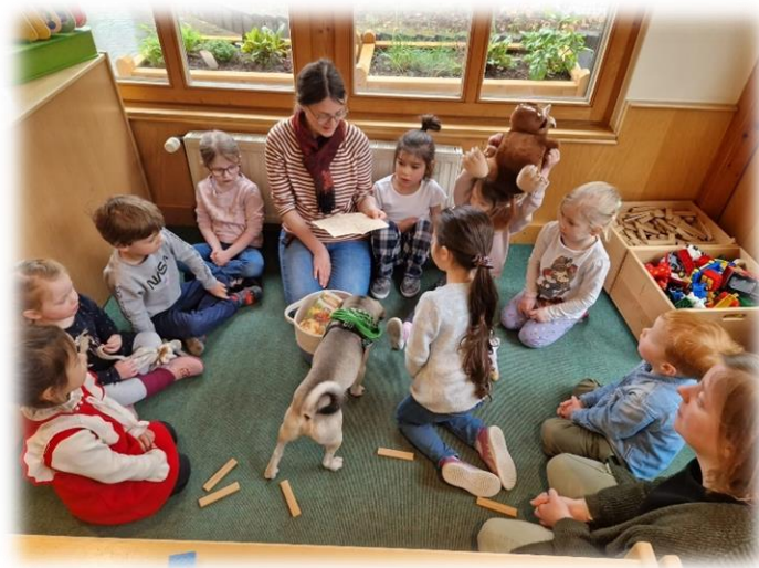
Im Rabenhort lernen wir von- und miteinander

Wir betreuen 22 Kinder von 3 bis 6 Jahren . Konzeptionell planen wir ein bis zwei Plätze für Einzelintegrationen ein. Seit 2012 haben wir uns im Team dazu entschieden Kinder mit und ohne Behinderung/Förderbedarf zu betreuen und konnten seitdem zahlreiche Erfahrungen sammeln. Unsere kleine, überschaubare und familiennahe Einrichtung ist eine hervorragende Möglichkeit zum Ankommen der Kinder. Sie können gemeinsam mit- und voneinander lernen. Auch die Erwachsenen lernen Hemmschwellen abzubauen und Vorurteile zu revidieren.