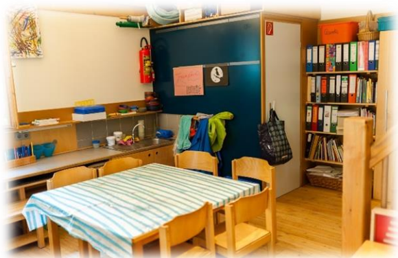
Der Gruppenraum: Malecke